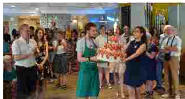
Événement lié au premier anniversaire du café des Pot'es en juin 2025

Après son ouverture en 2024, le café des pot'es , ouvert le jeudi et le vendredi de 16 h à 19 h, a soufflé sa première bougie en 2025 . Le café a aménagé sa carte (douceurs, des boissons bio et locales pour la plupart), maintenue ses binômes : des serveurs en situation de handicap épaulés par d'autres bénévoles.