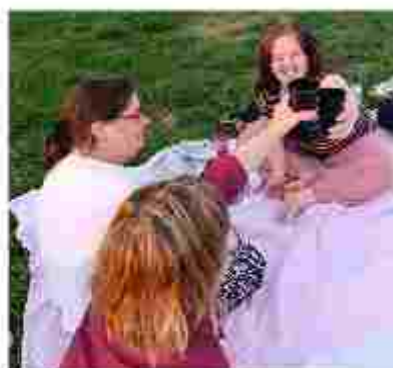
L'Oasix en sortie.

Dans toute cette dynamique, l'Oasix a appris à s'entraider dans les bons comme les mauvais moments. Le deuil a marqué la maison mais nous avons su nous soutenir, nous poser et accueillir la tristesse ensemble.