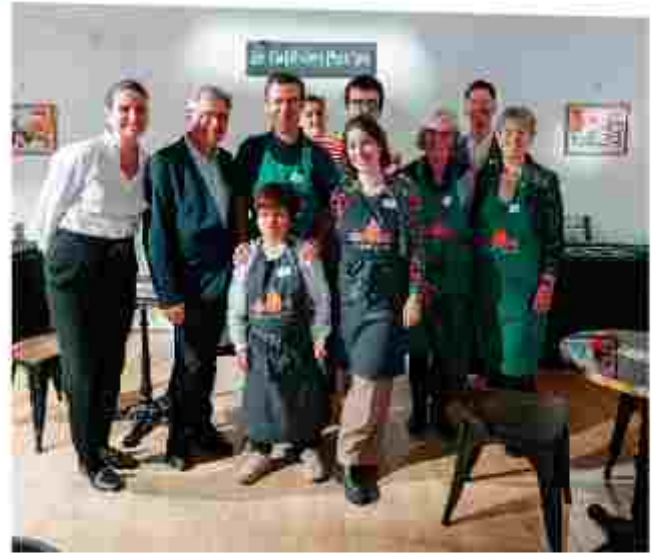
Délégation de L'Arche à Strasbourg présente à la soirée de Générosité à L'espace Commines, à Paris le 17 novembre.

Les retours sont unanimes : cette soirée a marqué les esprits. Nous sommes reconnaissants pour la collecte de 20.000 € qui a été affectée au Café des pot'es .