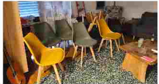
Les nouvelles chaises colorées de l'Oasix

Il y a un an, nous vous partagions que nous avions envie de changer nos tables de salle à manger et nos vieilles chaises. Bonne nouvelle, nous avons concrétisé ce projet ! Ça nous a mis le bazar mais c'était pour la bonne cause. Maintenant, nous ne sommes pas au bout de nos idées. Après les tables et les chaises, les murs et les buffets. On a hâte de continuer à décorer et réaménager notre belle maison.