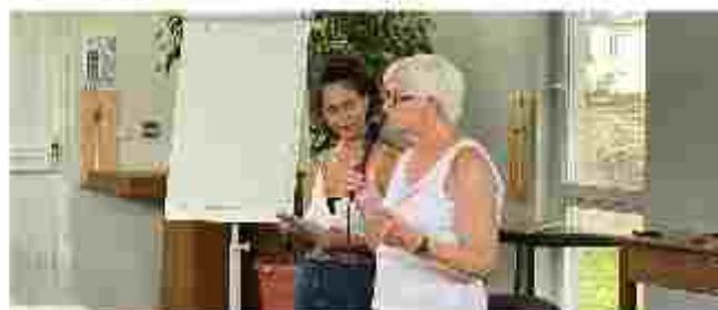
Rencontre régionale « Travail avec les familles »

Il y a une grande envie d'être en partenariat qui porte fruits pour les personnes. Un vrai enjeu est de trouver les canaux de communication adaptés à chacun. Souhait de poursuivre ensemble l'appréhension d'un certain nombre de sujets.