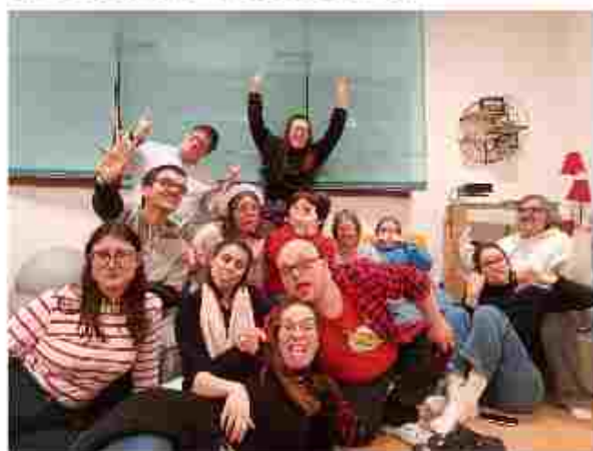
La Malisept et compagnie d'autres habitant.es

Malgré tout il s'est bien passé plein de belles choses (et pas mal mouvementées) cette année, on va vous faire un petit résumé.