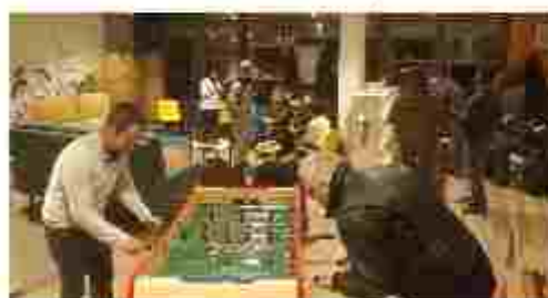
BabyFoot avec le SAVS

Un des objectifs de l'année 2025 était d'accueillir de nouveaux visiteurs. Le GEM a donc poursuivi sa stratégie de communication : le flyer mis à jour, site internet modifié, déplacements des adhérents dans les structures partenaires.