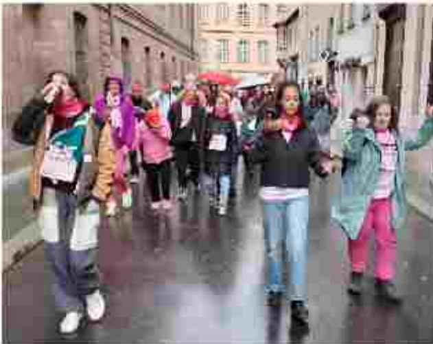
Groupe pour La Strasbourgeoise

Pour l'année qui vient, la question qui se pose est la suivante : la marche ou la course ? Arriverons-nous, un jour, à être l'association qui saura mobiliser le plus de personnes ? La prochaine édition nous le dira bien vite.