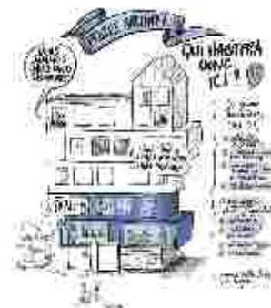
Illustration représentant le projet "Archipel" pour imaginer notre vie partagée de demain.

Une rencontre avec le directeur du pôle de l'autonomie de la CeA en début 2026 nous invite à continuer à travailler sur ce projet. On avance avec un double leitmotiv : soyons prudents et optimistes.