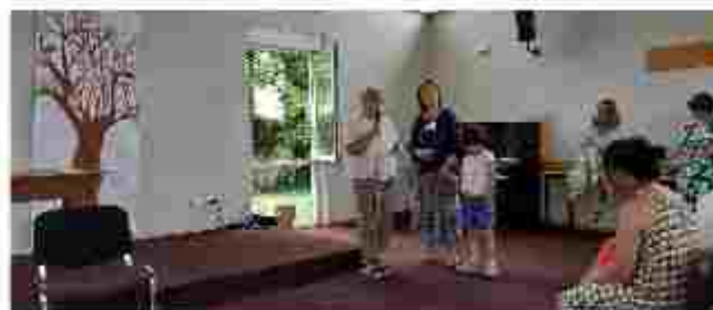
Rencontre régionale « Travail avec les familles »